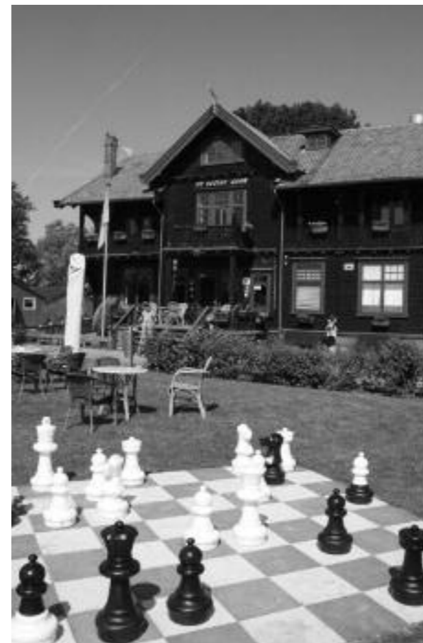
Stayokay prima locatie!

De eerste overnachting vulden de stuga's zich vooral gezinsgewijs. De tweede overnachting kozen de jongeren voor een meer leeftijdgebonden samenstelling van de stuga's, wel zo leuk met neefjes en nichtjes bijeen.