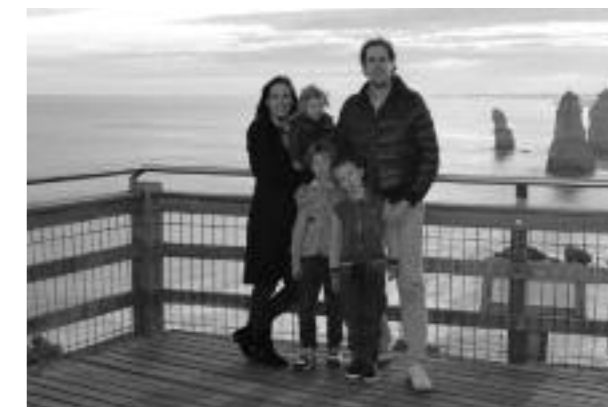
Genieten van de prachtige natuur Down Under

Hoe wij zijn opgevangen door de straat is echt geweldig! Maar met name is het ook bijzonder te ervaren hoe enorm flexibel kinderen zijn. Dat hebben we ons van te voren wel afgevraagd. Wat doen we de kids aan met onze hang naar avontuur? We hebben heel veel mooie trips gemaakt. De natuur is adembenemend en het reizen erg gemakkelijk. Vooral met kinderen. We reden de Great Ocean Road waar de jongens leerden surfen, waar we koala's aaiden en kangoeroes van heel dichtbij bekeken. We zagen de pinguïns aan land gaan op Phillip Island en tuurden daar (vergeefs) naar zeehonden op een eenzame rots. We hebben ons vergaapt aan de schoonheid van Tasmanië. Wineglass Bay, een van de mooiste stranden ter wereld, voeren we binnen met 6 dolfijnen langs. Al enkele weekenden brachten we door op Mornington Peninsula, wat ons doet denken aan de Provence. We vierden nieuwjaar op de Whitsundays en natuurlijk bezochten we ook Sydney. Maar, de meeste tijd brachten we door in dit heerlijke Melbourne. Het is een prachtige stad die eigenlijk, naar mate we haar beter leren kennen, steeds meer mooie kanten laat zien. Er is veel cultuur (nee, het is geen Europa), er zijn fantastische restaurants en er worden heel veel evenementen georganiseerd. En op wel zo'n hoog niveau, daar kan Amsterdam echt nog wat van leren. Deze stad verveelt nooit!