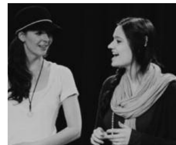
Docent aan het Rotterdams Conservatorium (links)