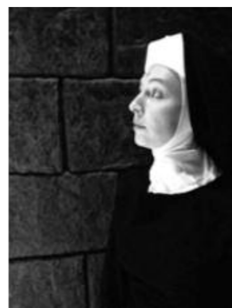
Als non in Sister Act