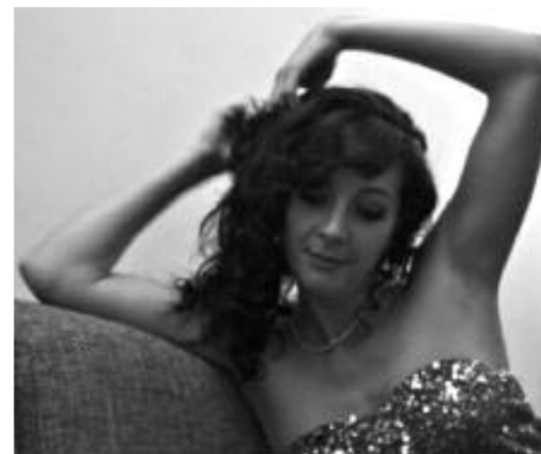
Na een première!